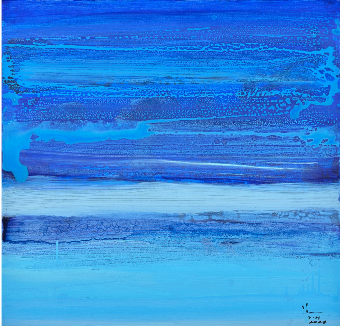
Confession 2024, oil on canvas, 80X80cm